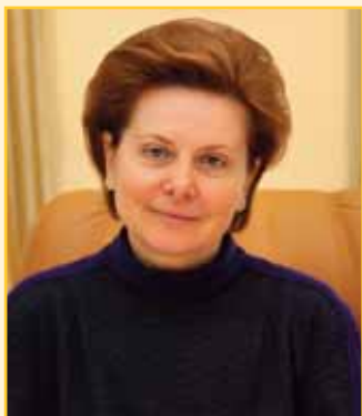
Н. Комарова Губернатор Ханты-Мансийского автономного округа — Югры