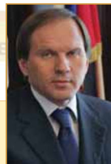
Губернатор Красноярского края

«Ванкор» принес стране и региону налоги, рабочие места, уверенность в возможности реализации новых качественных идей. Хочу в день рождения компании пожелать, чтобы каждый юбилей для вас был ознаменован запуском столь же масштабных проектов.