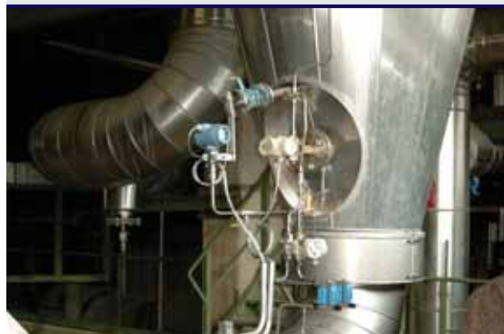
Фото 2 — Сенсор ERS высокого давления, установленный внизу резервуара

Применение новейших технологий не означает сложностей и многочасового обучения. Система 3051S ERS — это модернизированный вариант проверенной и хорошо знакомой технологии из-