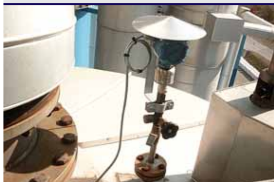
Фото 3 — Сенсор ERS низкого давления, установленный наверху резервуара

Применение новейших технологий не означает сложностей и многочасового обучения. Система 3051S ERS — это модернизированный вариант проверенной и хорошо знакомой технологии из-